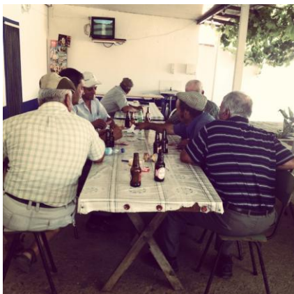
Blogue “Na Minha Merceria”