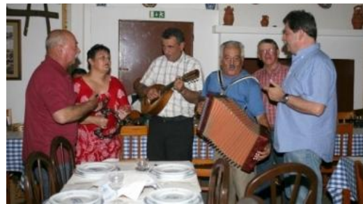
“Correio do Alentejo”