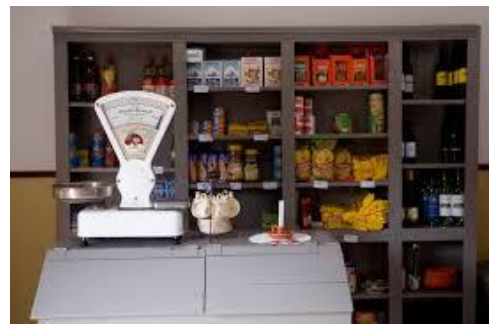
Blogue “Na Minha Merceria”