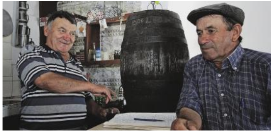
“Diário de Notícias”