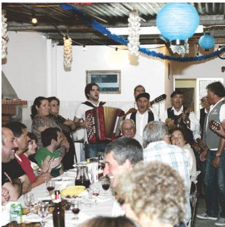
“Diário do Alentejo”